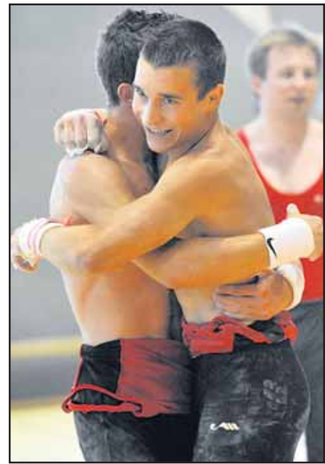
Domdidier s'envole aux anneaux alors que les spectateurs sont attentifs pour suivre la production de la Freiburgia aux barres parallèles. A droite, du pur bonheur du côté d'Ursy, quatre fois 2 e aux agrès...