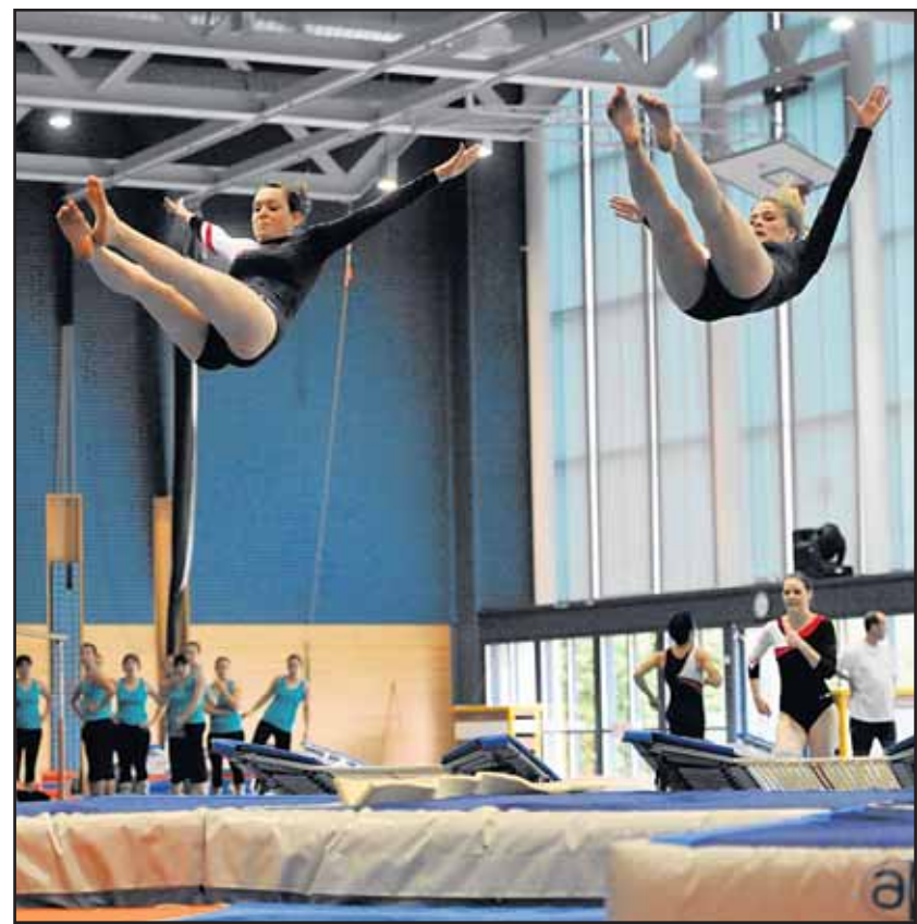
Les Bullois en action aux anneaux balançants et au saut pour décrocher deux titres fribourgeois. CHARLY RAPPO